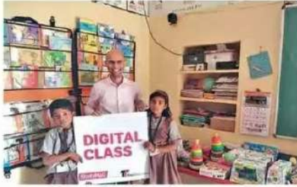
बडकवस्ती जि.प. शाळेला भेट वस्तू देताना मान्यवर. (दुसऱ्या छायाचित्रात) उद्घाटनप्रसंगी विविध पदाधिकारी आणि ग्रामस्थ.

बडकवस्ती शाळेच्या प्रगतीला आणखी गती देण्याचे कार्य ग्रामसंसद फळशीने केले आहे. ग्रामसंसदेने शाळेस एलईडी