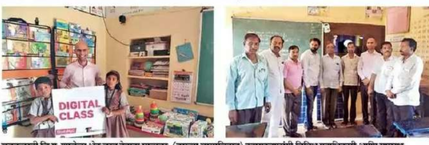
बडकवस्ती जि.प. शाळेला भेट वस्तू देताना मान्यवर. (दुसऱ्या छायाचित्रात) उद्घाटनप्रसंगी विविध पदाधिकारी आणि ग्रामस्थ.

बडकबस्ती शाळेच्या प्रगतीला आणखी गती देण्याचे कार्य ग्रामसंसद पळशीने केले आहे. ग्रामसंसदेने शाळेस एलईडी